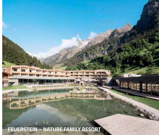
FEUERSTEIN – NATURE FAMILY RESORT

■ PRESULIS LODGES www.presulis-lodges.com