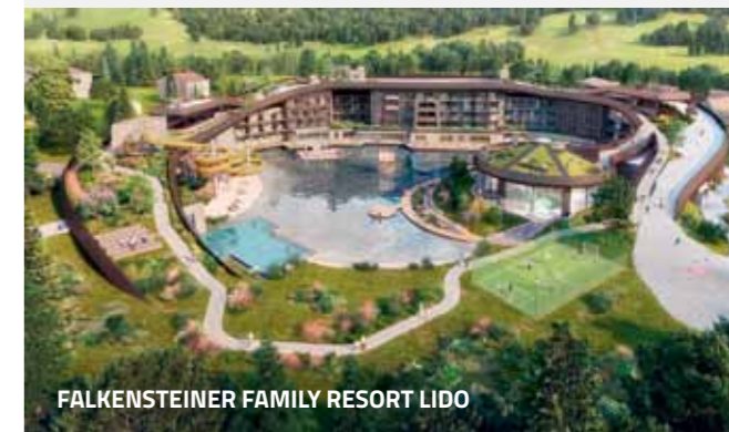
FALKENSTEINER FAMILY RESORT LIDO