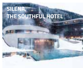
SILENA, THE SOUTHFUL HOTEL