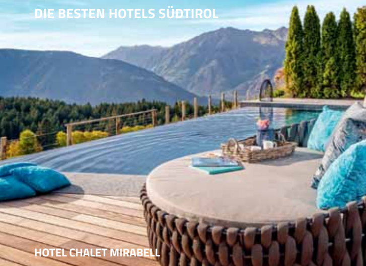
HOTEL CHALET MIRABELL