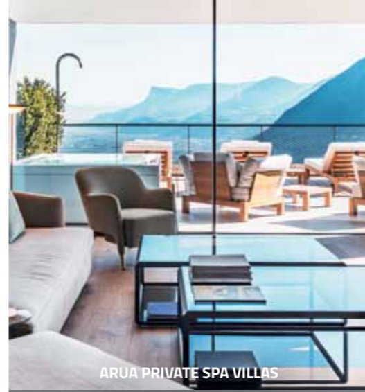
ARUA PRIVATE SPA VILLAS

Erstmals dürfen wir die Auszeichnung „Reader's Choice“ vergeben. Damit wird das Hotel vorgestellt, das die höchste Voting-Beteiligung für sich beanspruchen durfte: In der Kategorie Gourmet gelang dies dem Hotel Hirzer 2781.