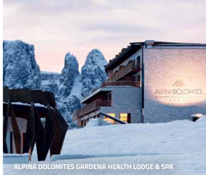
ALPINA DOLOMITES GARDENA HEALTH LODGE & SPA

Entschleunigen, entspannen, auftanken: exquisite Energiequellen für Auszeiten