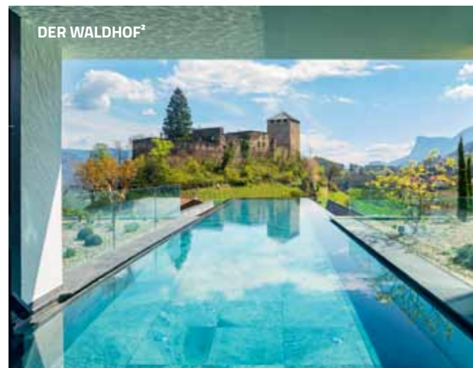
DER WALDHOF 2

Im Gsiesertal, auf 1250 Metern Seehöhe, wird im Juni ein Kraftplatz im Grünen eröffnet. Ein Hotel, das auf nachhaltige Bauweise setzt – inklusive Eco Farm und Green SPA – und Privacy pur bietet. Fontis bedeutet im Italienischen übrigens Einfachheit, was sich hier sicherlich nicht auf das Design und die Annehmlichkeiten bezieht, sondern auf das Lebensgefühl: Authentizität, die sich durch das ganze Haus zieht. www.farm-fontis.com