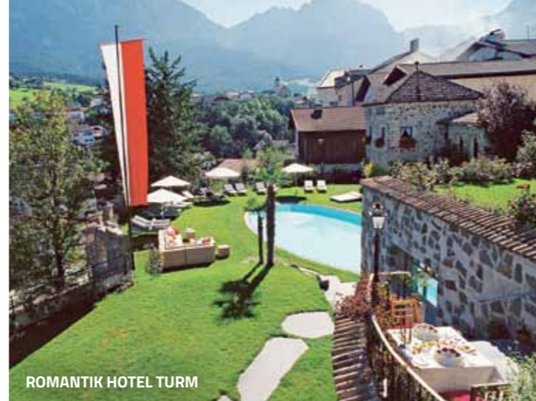
ROMANTIK HOTEL TURM

Mit Stil: Wenn innovative Ästhetik auf klassische Tugenden trifft.